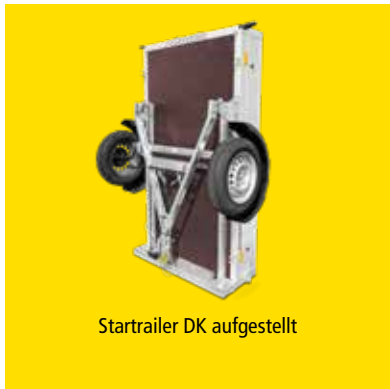
Startrailer DK aufgestellt