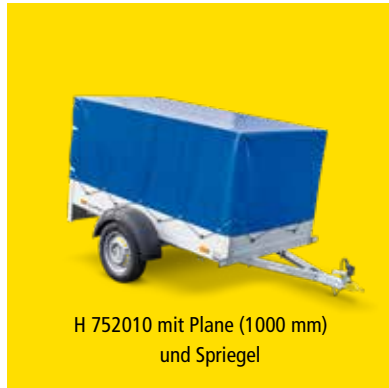
H 752010 mit Plane (1000 mm) und Spriegel