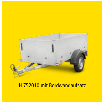
H 752010 mit Bordwandaufsatz