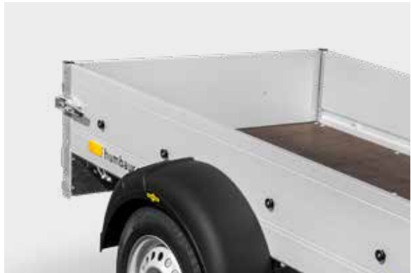
Bordwände aus eloxiertem, doppelwandigem Aluminiumprofil