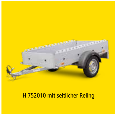
H 752010 mit seitlicher Relling