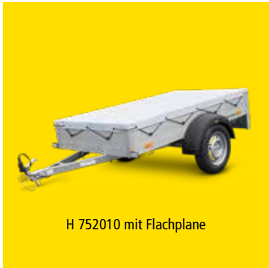
H 752010 mit Flachplane