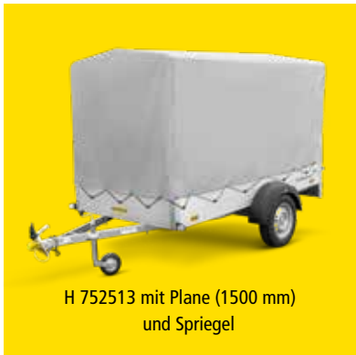
H 752513 mit Plane (1500 mm) und Spriegel