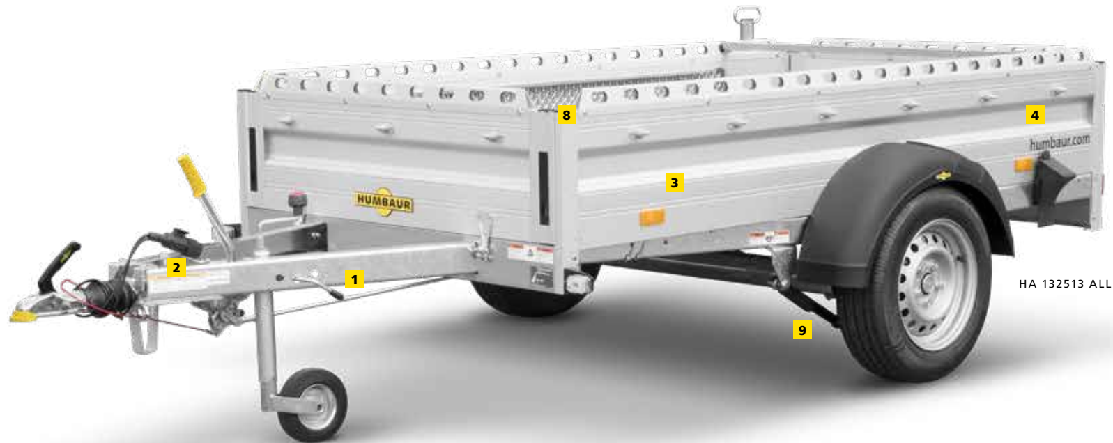
HA 132513 ALLROUNDER