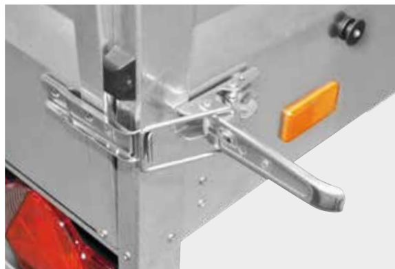
Spannverschlüsse an der Heckklappe