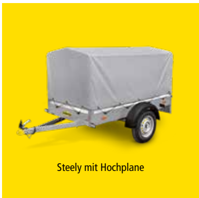
Steely mit Hochplane