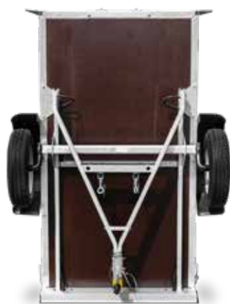
STEELY DK AUFGESTELLT