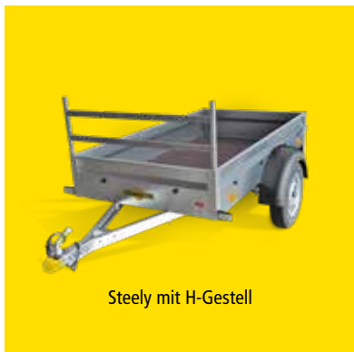
Steely mit H-Gestell