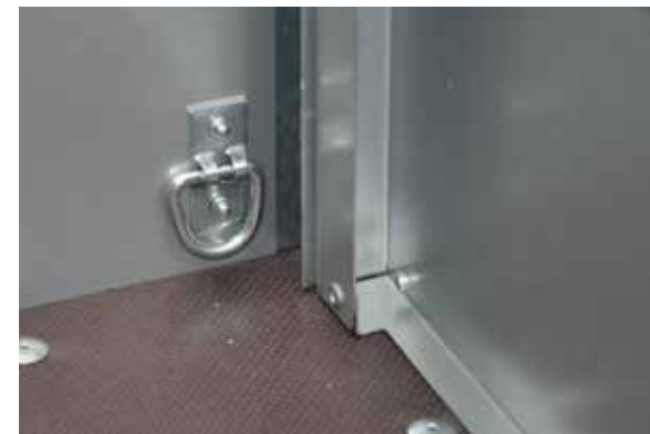
Vier an den Seitenwänden befestigte Anbinderinge