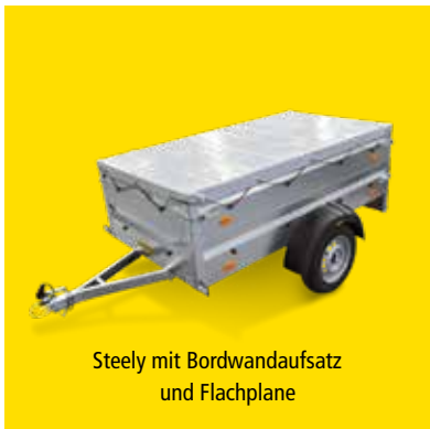
Steely mit Bordwandaufsatz und Flachplane