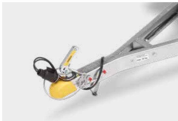
Feuerverzinkte V-Zugdeichsel mit Querstrebe