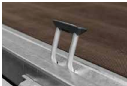
Direkt im Außenrahmen integrierte Zurringe (4 Stück)