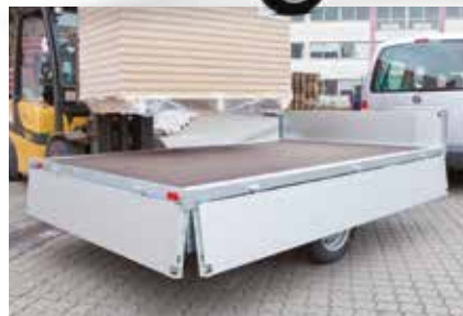
Ideal zum Beladen von allen Seiten