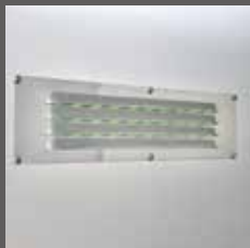
Innenansicht des Schiebelüfters für ein angenehmes Raumklima (optional)