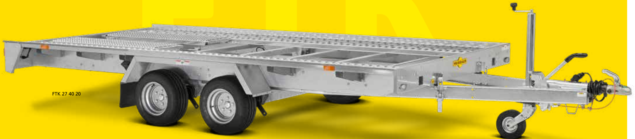
FTK 27 40 20