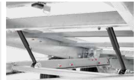
Stoßdämpfer für die mechanischen Kippfunktion