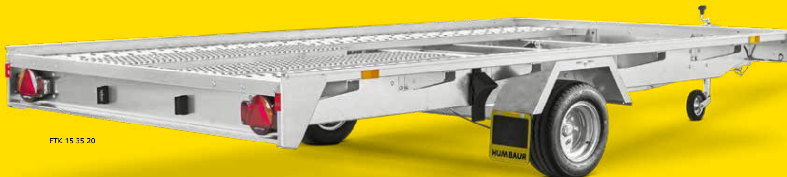
FTK 15 35 20

einem Smart oder VW Golf. Die im Detail durchdachte und stabile Bauweise sorgt für eine optimal ausgelastete Nutzfläche und einen niedrigen Ladewinkel. Verzinkte Komponenten und die zahlreichen Möglichkeiten zur Ladungssicherung bestätigen Ihnen die Qualität im Detail von Humbaур.