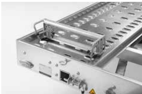
Optionaler Radanschlag zur Ladungssicherung