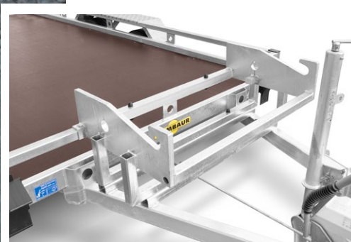
Baggerschaufelablage auf V-Deichsel (optional)