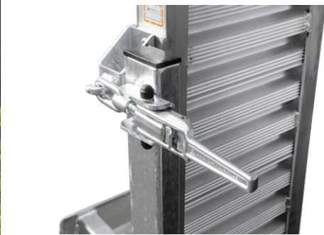
Optimierte, verstellbare Spannverschlüsse mit Gummipuffer